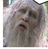
あの人(白銀) 銀の息子 正宗の子かも