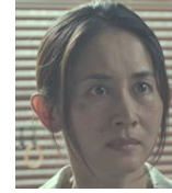
後藤 藍 元家畜