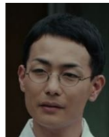
神山宗近 正宗の孫