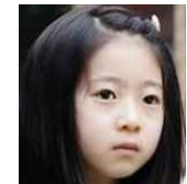
ましろ(小2) 心を閉ざしている