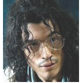
後藤理(サダム) 後藤家の輪を乱す者 の監視する一派の リーダー