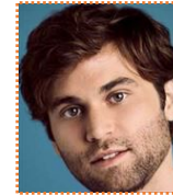
レヴィ・シュミット LGBT