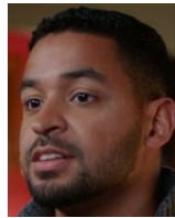
トレイ シモーヌの婚約者!?