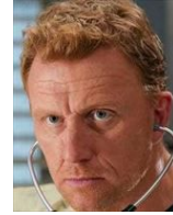
オーウェン・ハント 外科アテンディング