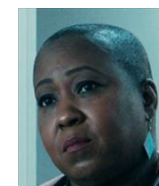
ハードリー ER ナース