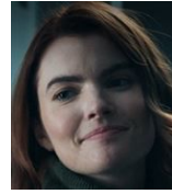
キンケイド(ケイド)・ サリヴァン ER 医師 FBI に協力