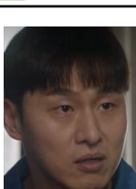
ムンチ 不法取り立て