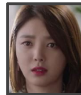
ナ・ヨニ 妻 息子ونس (実はミノの子ども?)