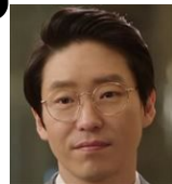
チャミノ ■兄ソノを殺害、その後、ソノに成りすます チャミョングループ代表、社長