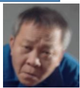
ミリョン 殺人容疑