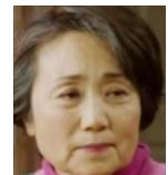
オ・ジュヒ ジスの母