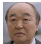
■父ヨウン チャミョン G 会長