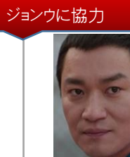
シン・チョルシン ヤクザ