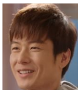
ユン・テス ジスの弟 看守