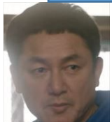
パンジャン 不法賭博、詐欺