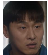
ムンチ 不法取り立て