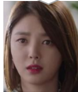
ナ・ヨニ 妻 息子ウンス (実はミノの子ども!?)