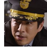
キム・ギョチュオル 刑務所所長