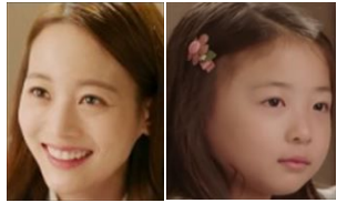
■ユン・ジス / ▲ハヨン ジョンウの妻 / 6歳遺体不明