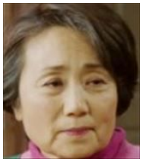
オ・ジュヒ ジスの母