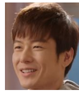
ユン・テス ジスの弟 看守