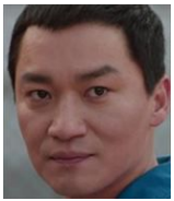
シン・チョルシク ヤクザ