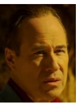
ボルサ エリオの手下