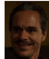
ラロ・サラマンカ ヘクターの甥