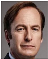
ジェームス・マッギル 弁護士に復帰 通称ジミー