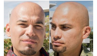
マルコ/レオネル・サラマンカ 双子