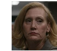
スーザン・エリクセン 検事補