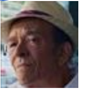
ヘクター・サラマンカ 介護施設