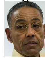
ガス・フリング ロス・ボジョス・エルマノス チキン店展開 裏でドラッグビジネスを展開