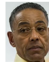
ガス・フリング ロス・ポジョス・エルマノス ボルサの手下