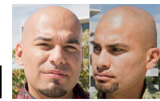
マルコ/レオネル・サラマンカ 双子