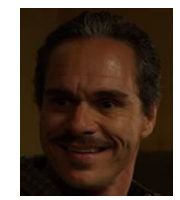
ラロ・サラマンカ ヘクターの甥