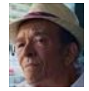
ヘクター・サラマンカ 介護施設