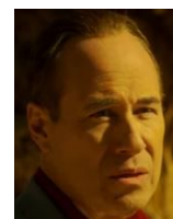
ボルサ エラリオの手下