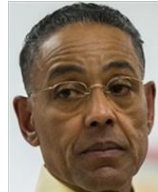
ガス・フリング ロス・ポジョス・エルマノス ボルサの手下