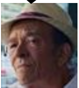
ヘクター・サラマンカ トッコの叔父