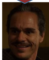
ラロ・サラマンカ ヘクターの甥