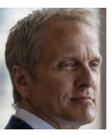
ハウード・ハムリン HHM 法律事務所 シニアパートナー