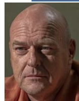
ハンク・シュレイダー