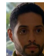
クレイジー・エイト