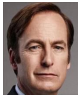
ジェームス・マッギル 弁護士に復帰 通称ジミー