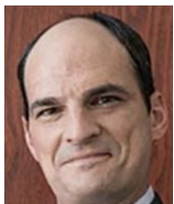
ビル・オークリー 地方検事補