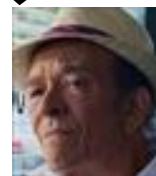
ヘクター・サラマンカ トッコの叔父