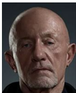
マイク・エルマントラウト 元警官