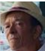
ヘクター・サラマンカ トッコの叔父