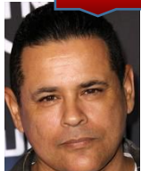
トッコ・サラマンカ