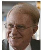
メイン 代表のひとり