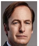
ジェームス・マッギル 弁護士 通称ジミー デヴィス & メインの アソシエイト