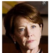
レベッカ・ボツ チャックの元妻!? バイオリニスト