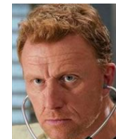
オーウェン・ハント 外科アテンディング 養子レオ