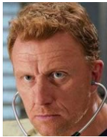
オーウェン・ハント 外科アテンディング 養子レオ