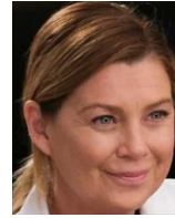
メレディス・グレイ 3児の母 外科アテンディング