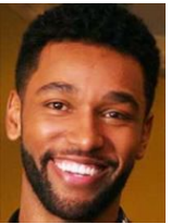
ウィンストン・ドッグ 心臓外科医