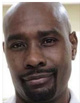
バレット・ケイン 凄腕脳神経外科医 リハビリを開始するが 解雇を言い渡される