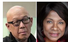
オースティンの両親