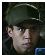
ポウ アボリジニ 家族は、祖母、母、弟