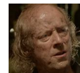
パトリック・フィッツジェラルド 1812年死亡(150年前) ヨラーナ初の市長