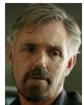
ヴィク・イーストリー