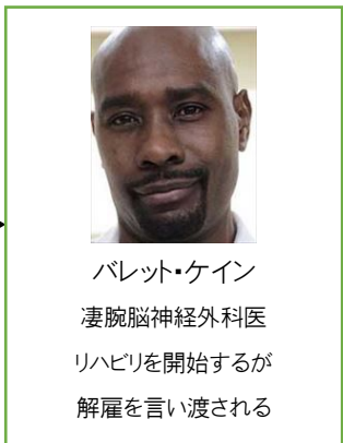
バレット・ケイン 凄腕脳神経外科医 リハビリを開始するが 解雇を言い渡される